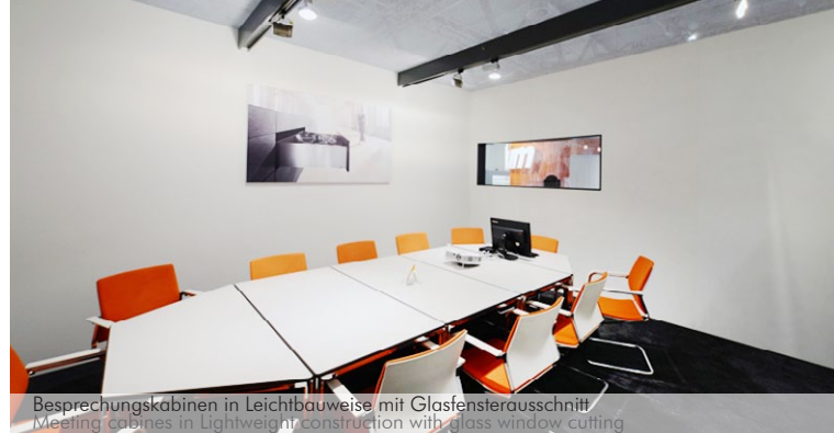
Besprechungskabinen in Leichtbauweise mit Glasfensterausschnitt Meeting cabins in Lightweight construction with glass window cutting

bewährte Exzentertechnik mit 5mm Hub, für einfaches Zusammenfügen und guten Fugenschluss tried and tested off-center technology with 5mm stroke, for simple assembly and good joint lock