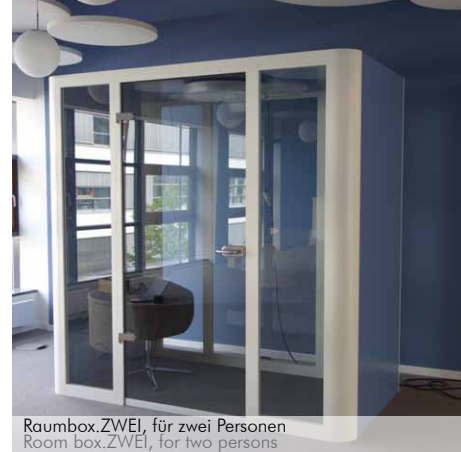
Raumbox.ZWEI, für zwei Personen Room box.ZWEI, for two persons